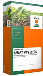
SMART KWS seeds Modern sugarbeet hybrids