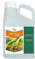
CONVISO® ONE Dedicated herbicide based on ALS-inhibitors