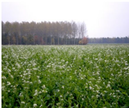
Een groenbemester verhoogt de biodiversiteit en kies de juiste groenbemester om daarmee ziekten en plagen in de bietenteelt te voorkomen en/of te beperken.

Zo kunt u bijvoorbeeld structuurschade voorkomen door gebruik te maken van banden met lage druk en zo mogelijk bovenover te ploegen. Op percelen met structuurschade is minder bodemleven aanwezig en zijn er vaker problemen met bodemschimmels, zoals rhizoctonia of violetwortelrot. Door een profielkuil te graven krijgt u meer informatie over eventuele storende lagen en het bodemleven.