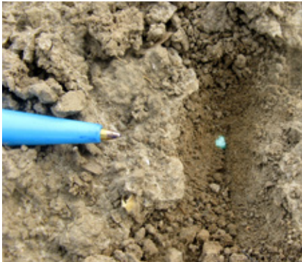
Om de oorzaak van een slechte opkomst vast te stellen zal het vaak nodig zijn om het zaad op te zoeken.

planten staan, nemen de overgebleven bieten de productie over en worden groter. Tenslotte moet de oorzaak van het slechte plantbestand bekend zijn en zijn opgelost. Of overzaaien loont, hangt van de zaaidatum af en van het plantaantal. Dit kunt u met de applicatie '(Over)zaai, opkomst en groei' zelf berekenen (zie kader).