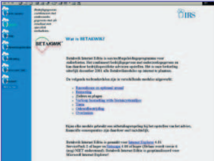
Figuur 2. Op deze pagina vindt u de Betakwik-onderdelen

Op www.irs.nl is een attenderingssysteem actief, met op dit moment ongeveer 500 gebruikers. Ook u kunt zich gratis abonneren op onze berichtenservice.